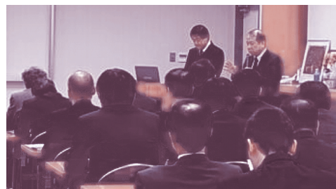
▲ 職場における企業研修会

また、企業へも、職場に出向いての「企業研修」や同僚の方への「具体的な支援の方法」などをお伝えすることもしています。