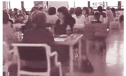
▲ 本人・家族交流会