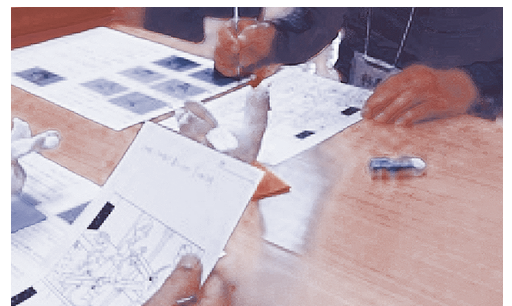
▲ 本人・家族の心理教育

2011年10月から、若年認知症の人達を中心とした働く場として、内職を受注し、作業活動を行っています。仕事の間は、「働く」ことで少しでも社会との空白期間を埋め、多くの人とつながることと、必要な時期がきたら、介護保険サービスへもスムーズに移行できることなどを目標にしています。