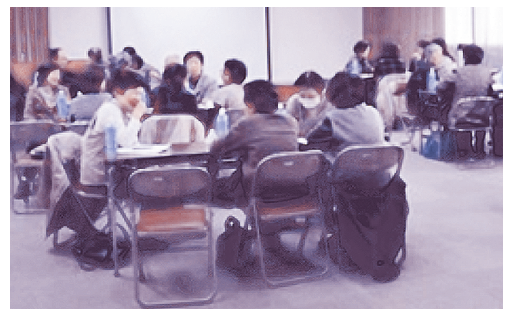
▲ 本人・家族交流会